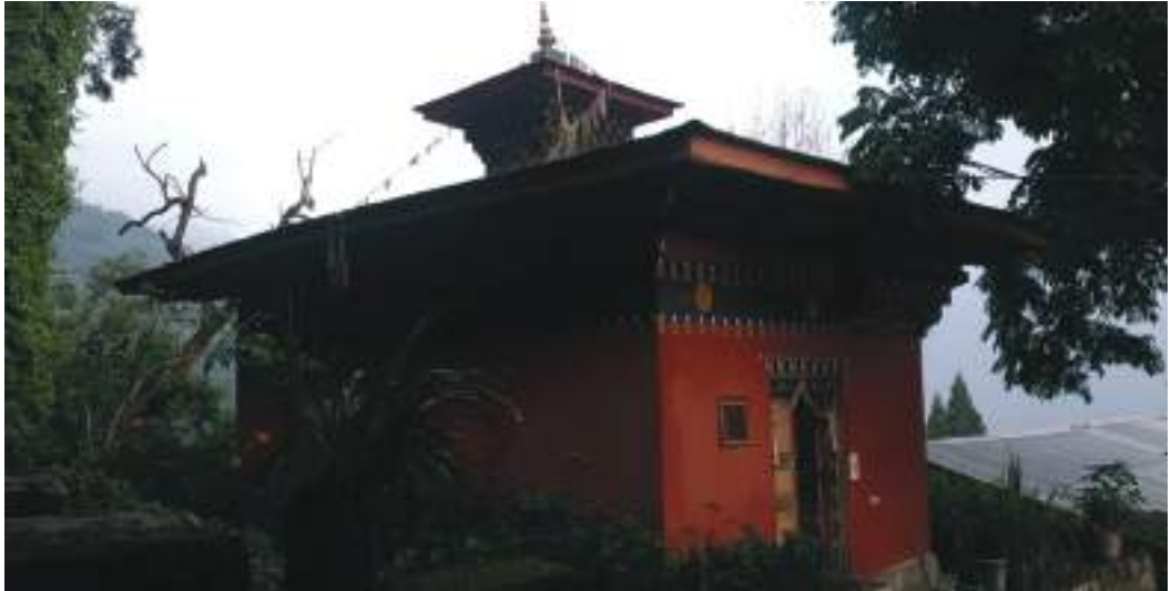
གནས་པོ་གཙང་ཉི་རི་གི་གནས་ལང་།

ཞུན་དག་པའི་བྲན་གསོ། གོང་གི་གནད་དོན་ཚུ་ གཞུམ་སྐར་ནང་ལུ་ཐོན་མི་དང་ཅོག་འབྲུག་མཐོང་མ་ལས་ ཞིབ་འཚོལ་པ་གིས་ནོར་འབྲུལ་ཅིག་མ་ཤོར་ག་མནོ་བའི་དོགས་པ་ཡོད་པ་ལས་ དཔུང་དགོཔ་འདུག།