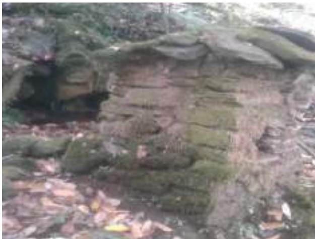
གནས་པོ་རྫོག་ གྲིང་སྤངས་ཀྱི་གནས་ཁང་།

བར་དོ་ས་སྤྲད་གཡུས་སློ་ལས་ ཀྱང་སྤོང་སྤེ་ཏུས་ལུ་རྒྱ་ཚོད་, དེ་ཅིག་ལམ་འགྲོ་བའི་སྐབས་ གནས་བདག་ རྫོག་ གྲིང་སྤངས་ཀྱི་གནས་ཁང་ཤིང་རིགས་སྤྲོ་ཚོགས་ འཛེམས་པའི་སྐབས་ལུ་ ཚོས་རྟེན་བཀྲིས་ཁང་བཟང་ ག་ཅིག་མཇལ་ཚུགས་པས།