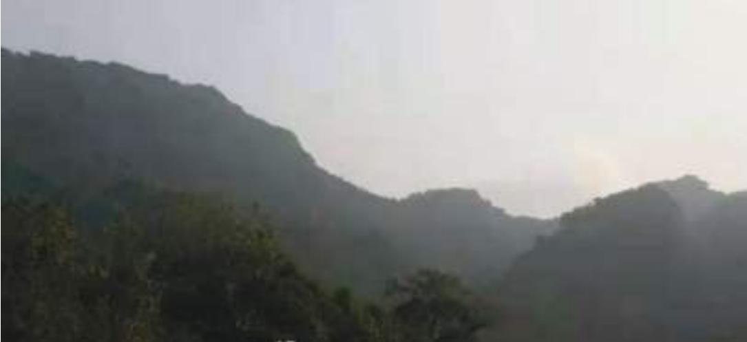
རིང་ལ་བཙན་གྱི་གནས་ཁང་།