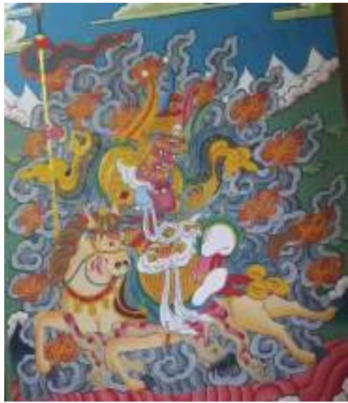
གསེར་སྤུང་བཙན་གྱི་སྤེབས་རིས།

གསོལ་ཁ་དཔེ་ཆ་ནང་ལྷ། སུན་ཚོགས་དཔལ་དང་ལྷན་པའི་གསེར་སྤུང་གའ་བ་གནས། །སྲིད་པའི་ལྷ་ཚེན་བཙན་རྗེ་དང་ དགའ་བ་བཟང་། །བཀའ་སློན་གཏེར་བདག་བརྩུན་མོ་ མངག་གཞུག་དང་། །ཁ་བར་བཙན་དང་རོང་བདག་ དཔེན་གནས་སྤུང་། །གཞན་ཡང་དོ་རྗེ་བྱ་བ་རི་ལྗོན་ ཤིང་སོགས། །གནས་པའི་ལྷ་སྤུང་བརྩུང་བཙན་སྤུང་མོ་ སོགས། །ཟེར་གསུང་དོ་བཟུམ་སྤེ་ གནས་སུན་སྤུང་ ཚོགས་པ་ གདུང་སྐྱོད་ལྷ་ཁང་འདི་ གསེར་སྤུང་བཙན་ དང་གནས་བདག་འཁོར་དང་བཙས་པའི་གནས་ཁང་ ཨིན་པའི་ཁང་ གདུང་སྐྱོད་སྤུང་འོག་ལས་རྒྱ་རྩྱུང་སྤེ་ རུས་ལུན་ཚུ་ཚོད་༣དེ་ཅིག་འགྲོ་དགོ་པའི་ས་ཁང་ཆགས་ ཏེ་ཡོད་པའི་ གསེར་སྤུང་ཟེར་མི་འདི་གནས་པའི་གནས་ ཁང་ཨིན་པའི་ཡིད་ཆེས་བསྐྱེད་ནི་འདུག