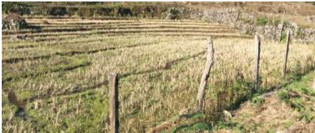
གཏེར་བདག་གི་སློབ་མཚོ་ཆགས་ལུལ།

གཏེར་བདག་མཚོག་ལུ་གསོལ་མཚོད་ཡང་ ཤིང་མཁར་སྤྱི་འོག་གི་མི་སེར་ཚུ་གིས་ ལྷ་རིམ་ཡར་འོ་མར་འོ་དང་ གཡུས་སློབ་འདི་ནང་ ལོ་ལྟར་གྱི་ལོ་མཚོད་སྐབས་སུ་ལ་ཞི་འདུག། གཡུས་དེ་ནང་ཆར་ཚུ་དེ་ཚུ་དུས་ཚོད་ཁར་མ་ བབས་པ་ཅིན་ གཏེར་བདག་དེའི་ཕོ་བྲང་རྩ་བར་སོང་སྟེ་ གསོལ་ཁ་ཚུ་སྤུལ་དགོ་དོ་ཡོད་པ་དང། གཏེར་བདག་ འདི་མེད་འོག་ནང་འཁོད་ཀྱི་ ས་གནས་ལག་ལྷ ཤིང་མཁར་སྤྱི་འོག་གི་ས་གནས་ཐིག་མ་རྩུང་དང་ཉིང་ཀར་འོང་ ཐམ་སྤྱིང་སྤྱི་འོག་གི་ས་གནས་པ་ཐ་དང་ རྩ་རྩི་སྤྱི་འོག་གི་ས་གནས་ རྩམ་བུ་བི་ཚུ་ནང་ དུས་མཚམས་ལྷོ་འོ་ གསུམ་དེ་རེ་འབྲུམ་སྟོན་དོ་པའི་ཡོད་པའི་ལོ་རྒྱུས་ ལྷམ་དགོ་ལེགས་ཀྱིས་བཤད་ཞི་འདུག། དམིགས་བསལ་དུ་རང་ལྷོ་ པའི་ཚེས་༡༠ ལུ་ མི་དམངས་འཛོམས་ཐོག་ལས་ འོ་མ་སྤྱིང་ལྷ་ཁང་ནང་ལུ་སྟེ་ གསོལ་ཁ་སྤུལ་སྟོལ་ཡོད་པ་ཨིན་པས།