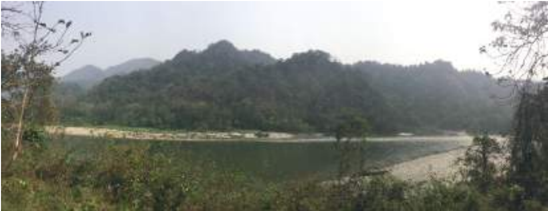
ལ་རྣམས་ ལྷ་མ་རྩུ་ཇོ་འི་ཕོ་བྲང་།

བསོད་ནམས་ཐང་སྤྱི་འོག་ལས་ ལྷ་མ་འཁོར་ནང་འགྱུ་བའི་སྐབས་ ཏུས་ཡུན་ ཚུ་ཚོད་, དང་སྐར་མ་༣༠ དེ་ ཅིག་ལུ་ ལྷ་ནམས་གླིང་ཀ་ནང་ལྟོད་ཚུགས་པས་ ལྷ་ནམས་གླིང་ཀ་འི་གདོང་ཕྱོགས་ལུ་ དེ་མ་རྩུ་ཇོ་འི་ཕོ་བྲང་སྤྱོད་ བུང་ནགས་དང་མེ་ཏོག་ ལྷ་ཚོགས་ཤར་ཏེ་ རི་དྲགས་སེམས་ཅན་སྤྱོད་ཚོགས་འབྱུང་ལས་ཏེ་ ཡོད་པའི་ནང་ལྟོད་ ཚུགས་པས། མཚན་གཞན་ཡང་། གསོལ་ཁ་དཔེ་ཆ་ནང་དུ་ བྱ་རོགས་མིང་ཅན་ཕོ་ཉ་བ། ཟེར་ཕོན་དོ་བཟུམ་ སྤེ་ བྱ་རོགས་ཟེར་ཡང་ལུ་མེད་ཅི་ལས།