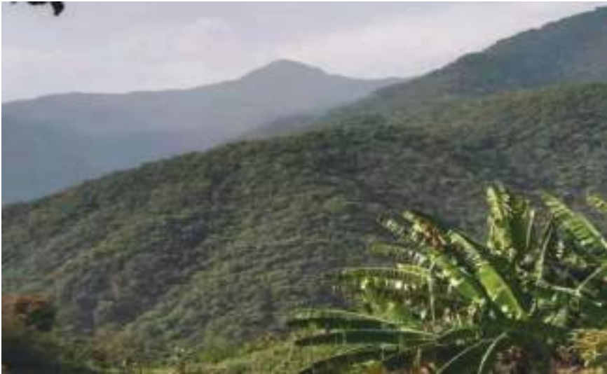
གྲིམ་བྱང་པའི་གནས་ཁང་།

ཤིང་ཆེན་མང་པོས་བསྐོར་ཏེ་ སྤོ་ལུང་ལྡན་སྟེ་ ག་ནི་བ་ཡ་མཚན་ཆེ་ཏོག་ཏོ་སྟེ་ གྲིམ་བྱང་ལུ་མཐོང་ཚུགས་པས།