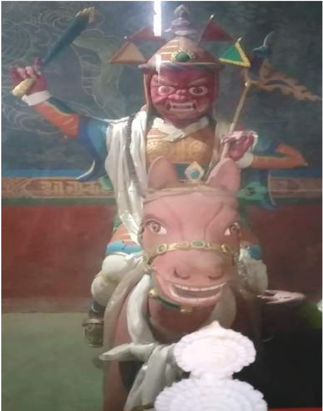
གནས་པོ་གཙང་ཉི་རེ་གི་སྐུ་འདྲ།