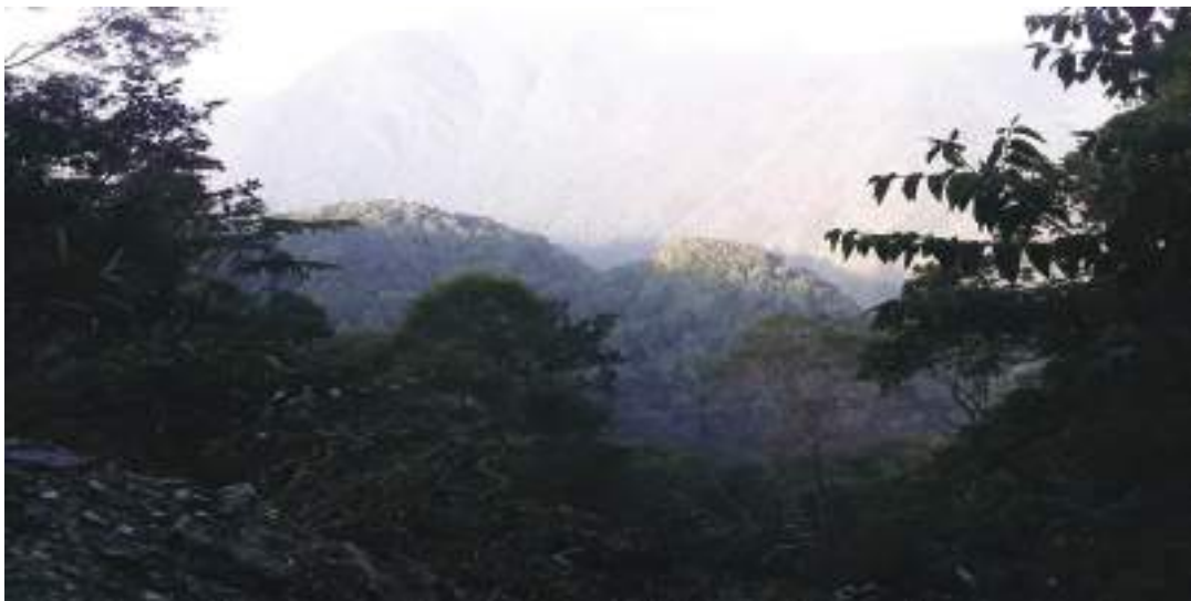
རོ་མཁར་མོ་མཁར་གནས་ཁང་།

གནས་བདག་རོ་མཁར་མོ་མཁར་གྱི་གནས་ཁང་ནང་ འགྲོ་ནིའི་དོན་ལས་སྐྱུམ་འཁོར་ལམ་མ་གྟོད་པས་ ཡིན་ རུང་ ཕྱི་མོང་སྤྱི་འོག་ལས་རྒྱང་ཐང་སྟེ་ འགྲོ་བ་ཅིན་ དུས་ལུན་ཚུ་ཚོད་། དེ་ཅིག་འགྲོལ་ད་ ཤིང་ནགས་ཀྱིས་ བསྐོར་བའི་ རི་ཆེན་གཉིས་ཡོད་སའི་ས་ཁོངས་ནང་གྟོད་ཚུགས་པས།