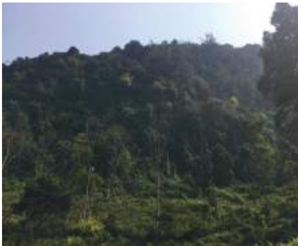
རོ་རྗེ་འབྲུག་རྒྱལ་ཁབ་གི་གནས་ཁང་།

སྐྱེས་བཙན་རོ་རྗེ་འབྲུག་རྒྱལ་ཁབ་གི་གནས་ཁང་ཡང་ གཞུང་སྲིད་སློབ་གྲུ་ཉེ་འདབས་ལུ་ སྤྱི་ལུང་དང་ ལྷན་པའི་ གནས་པོ་རོ་རྗེ་འབྲུག་རྒྱལ་ཁབ་གི་གནས་ཁང་ ཕྱི་ལྷགས་ཅི་ནགས་ཀྱིས་བསྐྱོར་ནས་ དྲི་ཞིམ་ པའི་མེ་ཉོག་སྐྱ་ཚོགས་ཤར་ཉེ་ ཡོད་པའི་གནས་ ཁང་ནང་གཞུང་སྲིད་ཆེད་འོག་ལྷེ་བ་ལས་ ཀྱང་ ཐང་སྤེལ་འབྱོར་བའི་སྐབས་ དུས་ལུན་ ལྷན་པ་ ༣༠ དེ་ཅིག་ལུ་སྤོང་ཚུགས་པས།