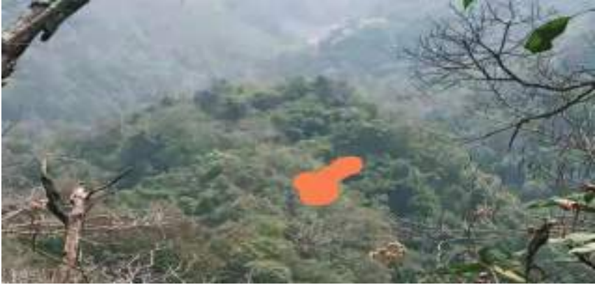
འཛམ་གླིང་རྒྱལ་པོའི་གནས་ཁང་།