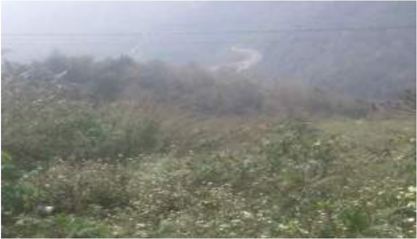
བ་ཀ་སྒྲིང་པའི་གནས་ཁང་།