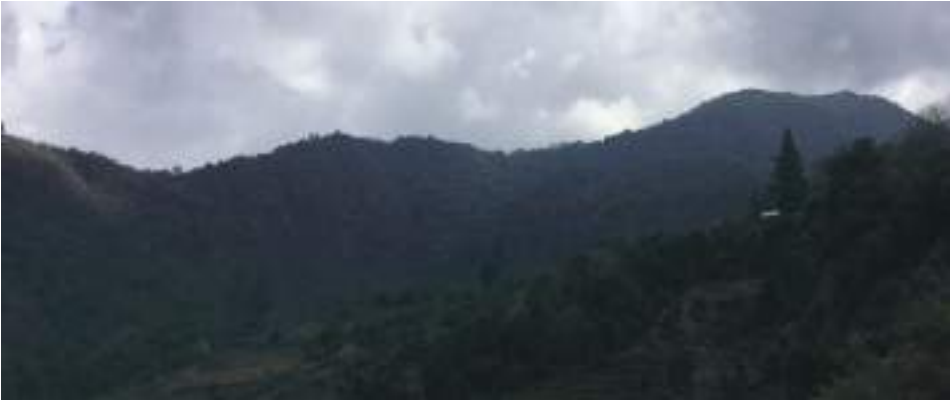
གདོང་ཀ་ལི་བཙན་གྱི་གནས་ཁང་།

བར་དོ་ར་བ་ཐང་ལྷ་ཁང་ལས་གཡུས་ཚུགས་ལུ་ ཀང་ཐང་སྤེ་དུས་ཡུན་སྐར་མ་༣༠ དེ་ཅིག་ལམ་འགྲོ་བའི་ རྒྱབས་ ས་གནས་གདོང་ཀ་གླིང་ཟེར་ས་ལུ་ སྤོ་སྤོན་གྱི་ཤིང་རིགས་སྤོ་ཚོགས་འཛོམས་པའི་རྒྱུག་ལུ་ ཐོ་བྲང་ རིན་ཆེན་གསེར་གྱི་རང་བཞིན་བྲག་རི་བཙུགས་ཏེ་ཡོད་པའི་བཙན་དབང་ཕྱུག་ཆེན་པོའི་ཐོ་བྲང་འདི་ནང་སྟོན་ ཚུགས་པས། ཡིན་རུང་བར་དོ་སྤྱི་འོག་ལས་མཇལ་བའི་རྒྱབས་ གངས་རི་རིན་ཆེན་ལོར་བུའི་རྣམ་པ་སྟེ་མཇལ་ནི་ འདུག།