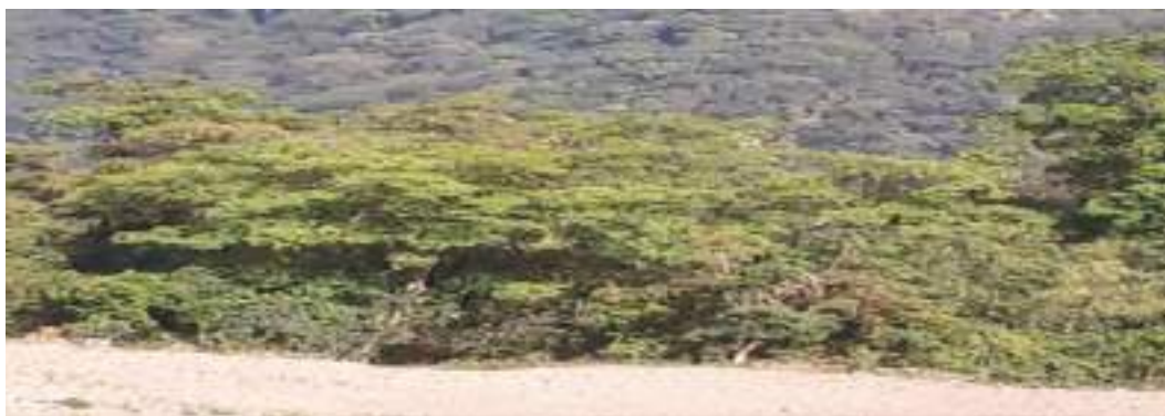
རྒྱ་གར་ཡིད་བཞིན་ནོར་བུའི་གནས་ཁང་།

གཡུས་སློ་འདི་ནང་ཡོད་པའི་ས་གནས་བྲག་མགོ་ལུ་ རྒྱ་གར་ཡིད་བཞིན་ནོར་བུའི་ཕོ་བྲང་ཡང་ ཤིང་ཆེན་ནགས་ ཀྱི་བརྒྱུན་པའི་ སྤི་ཞིམ་པའི་མེ་ཏོག་སྣ་ཚོགས་ཤར་ཏེ་ ཡོད་མི་འདི་མཇལ་བར་འགྲོ་ནི་དོན་ལས་ གཡུས་སློ་ འདི་ནང་ལས་རྒྱང་ཐང་སྟེ་འགྲོ་བའི་རྒྱབས་ ལུ་ལུན་ཚུ་ཚོད་ཏེ་ཅིག་ལུ་སྟོད་ཚུགས་པས།