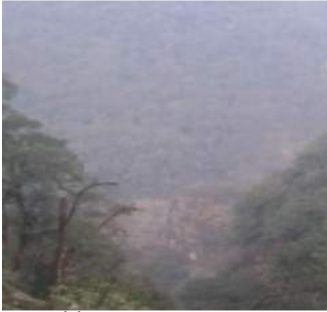
སྤྱི་སྤྱིས་ལ་ཕོ་མཁར་མོ་མཁར་གནས་ཁང་།