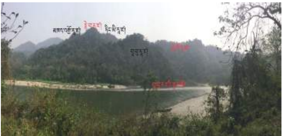
མ་རྒྱུ་སི་གནས་པོ་ལུ་གི་གནས་ཁང་།