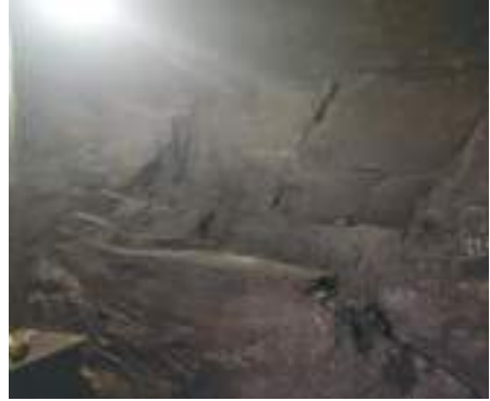
ཚེ་རིང་མའི་གནས་དོ།