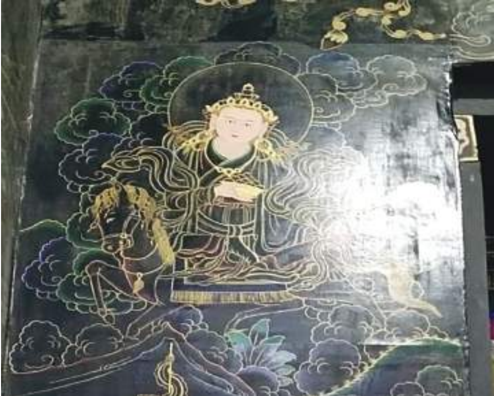
ཡོངས་ལ་མགོན་ཁང་ནང་ཡོད་པའི་ གནས་པོ་འདོད་ཡོན་བཟང་པོའི་ལྷེབས་རིས།

ཡོངས་སྤོང་ འབྲོར་པ་ལྷན་པའི་གདུང་བསམ་བདེ་བའི་ཐང་གི་སྤོང་ལུ་ གཟི་བཟིན་སྤྱན་སྲུང་ཚོགས་པ་ རང་ བཞིན་ལྷན་གྱིས་འགྲུབ་པའི་ རི་བྲག་ཆེན་པོ་ ལྷའི་པོ་བྲང་དང་དབྱེ་བ་མེད་པའི་ ལྷོ་མེ་རུ་ཞེས་པའི་ མཐོན་པོ་ གནས་གྱི་ཀ་བ་ཆེན་པོའི་ནང་ལུ་ སྤྱུལ་པའི་ལྷ་མཚོག་ དགེ་བསྟེན་འདོད་ཡོན་བཟང་པོ་མཚོག་འཁོར་དང་ བཅས་པ་སླེ་བཞུགས་ཏེ་ཡོད་པ་ཨིན་པས། བཟོ་སྐྲུལ་རྗེད་འོག་ལས་ སྤྱུལ་འཁོར་ནང་དུས་ཡུན་སྐར་མ་ ༣༠ ཏེ་ ཅིག་འགྲོ་བའི་སྐབས་ ཡོངས་ལ་དགོན་པའི་ལྷ་ཁང་ནང་སྤོང་ཚུགས་པས། གནས་པོ་འདོད་ ཡོན་བཟང་ པོའི་མགོན་ཁང་ཡང་ཡོངས་ལ་དགོན་པའི་ལྷ་ཁང་ཐོག་དང་པའི་ནང་ལུ་མཇལ་ནི་འདུག།