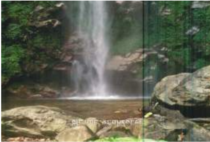
ཅང་ཅང་མ་གནས་པའི་ས་སྒོ།

ལིམ་ཕུ་བཙན་གྱི་གནས་ཁང་། འདི་བརྩམ་སྡེ་ གཡུས་སྒོ་འདི་ནང་ཡོད་པའི་ གནས་པོ་ཅང་ཅང་མའི་ཕོ་བྲང་ བང་འགྲོ་ནི་དོན་ལས་ ཀང་ཐང་སྡེ་དུས་ཡུན་སྐར་མ་ ༣༠ དེ་ཅིག་ལམ་འགྲོ་དེ་གིང་རིགས་སྒྲ་ཚོགས་བསྐོར་བའི་ དབུས་སུ་ རྒྱའི་རྒྱུན་གྱི་མེ་རྟོག་བབས་ཏེ་ཡོད་པ་སྡེ་མཇལ་ཚུགས་པས།