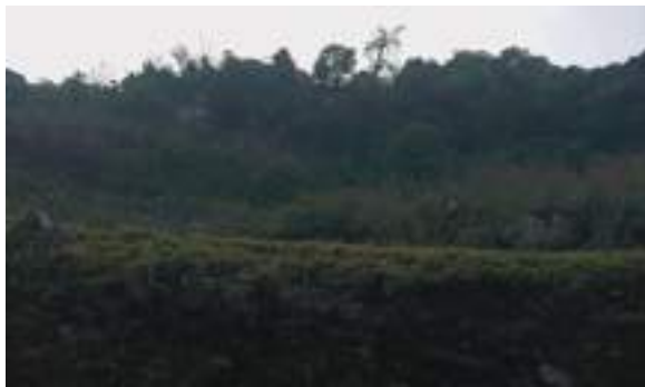
ལ་ཞིང་བྲག་གི་གཞི་བདག་ལ་ཞིང་དོ་རྗེའི་གནས་ཁང་།

གསོལ་ལ་དཔེ་ཆ་ནང་ལས་ གྱི། རང་སྤང་ལྷན་ཆགས་བཟུ་གིས་དཔལ་གྱི་རི། ཡིད་འོང་དགའ་སྦྱིད་ལྷན་པའི་ པོ་བྱང་ནས། ཡུལ་འདི་སྦྱོང་བའི་གཞི་བདག་མཐུ་བོ་ཆེ། ལ་ཞིང་དོ་རྗེ་འཁོར་བཅས་ད་ཚུར་བྱོན། ཟེར་རང་ བཞེན་ལྷན་གྱིས་གྲུབ་པའི་ བགྲིས་དཔལ་གྱི་རི་ལུ་ ཡིད་དུ་འོང་བའི་ཤིང་དང་ནགས་གྱི་དབྱས་སུ་ དགའ་སྦྱིད་ ལྷན་པའི་པོ་བྱང་ནང་ལུ་བཞུགས་ཏེ་ཡོད་པ་ཨིན་པས། ཨིན་རུང་ གཡུས་སྒོ་འདི་ནང་ཡོད་པའི་བདེ་ཆེན་ཚོས་ སྦྱིང་ལྷ་ཁང་གི་ཉེ་འདབས་ལུ་ ལ་ཞིང་བྲག་གནས་པའི་གནས་ཁང་ནང་འགྲོ་ནིའི་དོན་ལས་ རྟེན་ཐང་སྤེལ་འགྲོ་ བའི་སྐྱབས་ དུས་ལྷན་སྐྱར་མ་༡༠དེ་ཅིག་ ལུ་ ཤིང་དང་ནགས་གྱི་བརྒྱན་པའི་ བྲག་རི་བརྟེན་པའི་ སྤང་ ཤོང་ཉམས་དགའ་བའི་ཚལ་ནང་ལྟོད་ནི་འདུག།