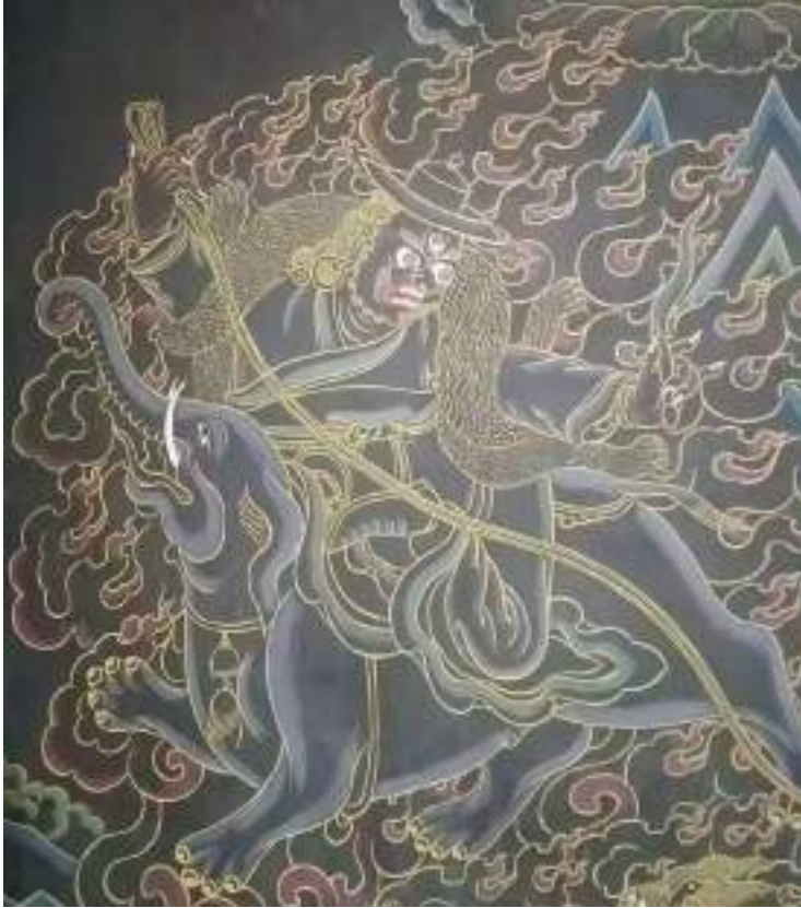
མཁར་ལྷ་ཁང་ནང་བཞུགས་ཡོད་པའི་རྒྱལ་པོ་པེ་ཉར་གྱི་ལྷེབས་རིས།