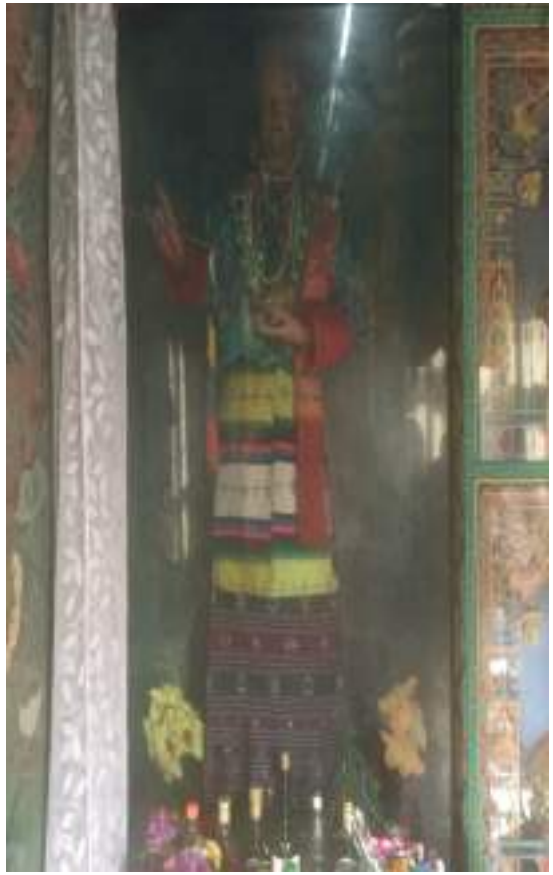
སྐྱབ་བཙུན་པ་སྐྱ་ལྷམ་ཏེ་ཡེ།