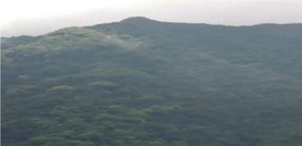
བྱང་རྒྱལ་པོ་བཙམ་གྱི་གནས་ཁང་།

བྱང་རྒྱལ་པོའི་ཕོ་བྲང་འདི་ བགྱིས་སྤྲིས་གཡུས་སློ་འདི་ནང་ལས་བྱང་ཁ་ཐུག་ལུ་ ཀར་སྟོང་སྟེ་འགྲོ་བའི་སྐབས་ དུས་ལུ་ཕུན་སྐར་མ་། དེ་ཅིག་ལུ་ ཤིང་དང་ནགས་ཀྱི་བརྒྱུན་པའི་རི་འབྲུར་ རི་རྒྱལ་ལྟར་མཐོ་བ་སྟེ་མཇལ་ ཚུགས་པས།