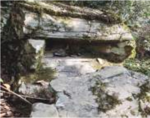
བམ་དོར་པའི་གནས་ཁང་།