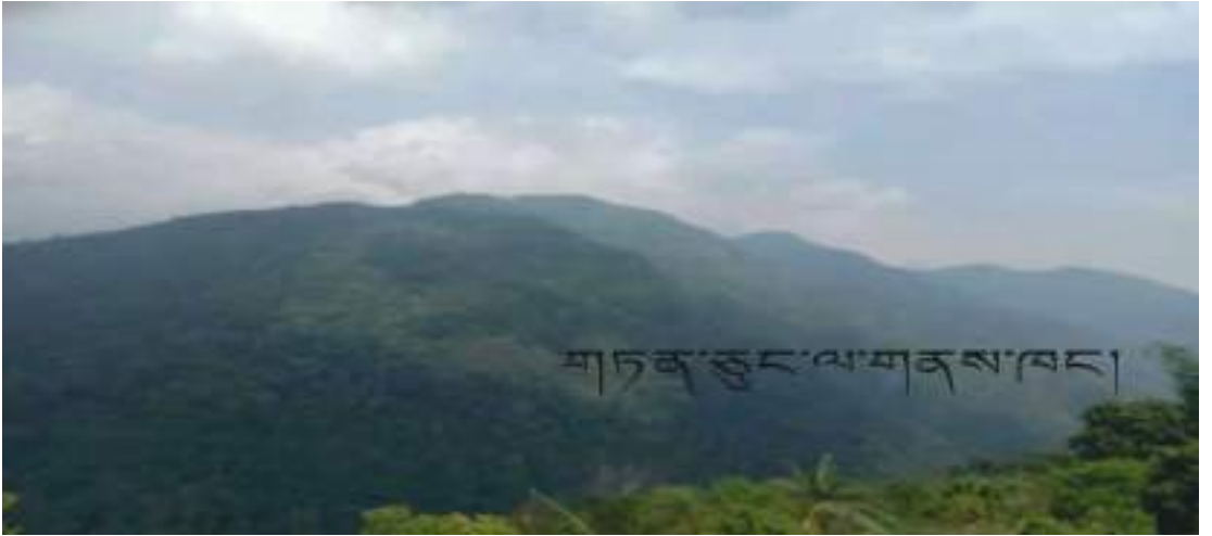
གཏན་ཅུང་ལ་བཙན་གྱི་གནས་ཁང་།