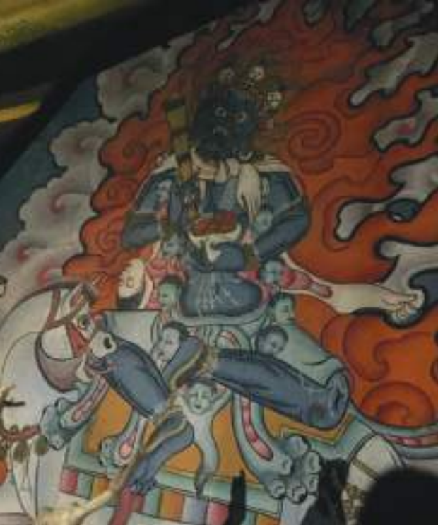
གྲོང་ལྷ་ཁང་ནང་ལུ་ཡོད་པའི་ གནས་ཕོ་མ་མ་གོ་གོ་(ལྷ་མོ་རེ་མ་ཉི)གི་ལྷེབས་རིས།

རོ། །ཕྱག་གཡས་བདུད་ཀྱི་ཁྲམ་ཤིང་གཡོན་ཐོད་ལ། །ཞིང་བཅུའི་བསྟན་དག་ཚམ་ལ་འབེབས་པའི་ ཉགས། །དབུ་སྐྱ་དམར་སེར་གྲེན་དུ་འཕྱོ་བའི་གསེབ། །ཟླ་བའི་ཚད་པན་མཛེས་ལ་བདག་བསྟོད་དོ། །ཐོད་སྐྱམ་ དབུ་རྒྱུ་མི་མགོ་དོ་ཤལ་དང་། །གཏུག་སྐྱུལ་རུས་རྒྱུ་སྐྱང་ཆེན་གོ་རྒྱོན་གྱོན། །ཞེས་པ་ལྟར་གནས་བདག་མ་མ་ གོ་གོ་འདི་ གནས་བྱང་ཤར་ ཚོས་དབྱིངས་ཕོ་བྱང་ནང་ལུ་ ཞལ་གྱི་མདོག་ནི་ སྐྱུ་མདོག་མཐིང་ནག་སྟེ་ ཡོད་པ་ཨིན་པས་ དེ་སྟེ་ཡོད་དགོ་མི་འདི་ ཚོས་ཉིད་འགྱུར་བ་མེད་པའི་ཉགས་མཚན་ཨིན་པས། ཆིབས་ནི་ རྟེལ་ཉ་རྐང་པ་གསུམ་ལ་ བཞོན་ནས་ ཕྱག་གཡས་པ་ བདུད་ཀྱི་ཁྲམ་ཤིང་དང་ ཕྱག་གཡོན་པ་ ཞིང་བཅུ་ བསྟན་དག་ཚར་གཙོད་པའི་ཕྱིར་ ཐོད་ལྷ་བསྐྱམས་ ཉས་དབུ་སྐྱ་ དམར་གསེར་གྲེན་དུ་ལོག་སྟེ་ ཟླ་བའི་ཚད་ པན་ལྟར་མཛེས་པའི་ རྒྱུ་ཆ་འདི་ ཐོད་སྐྱམ་དབུ་ལ་བརྒྱུན་ཏེ་ མགུལ་དུ་ མི་མགོ་དོ་ཤལ་དང་སྐྱུལ་གྱི་རྒྱུ་ དང་སྐྱང་ཆེན་གྱི་གོ་བ་གྱོན་ཏེ་ ལམས་གསུམ་བསྐྱོར་ཏེ་ སེམས་ཅན་ཀུན་ལུ་འགོ་དོན་མཛད་ཏེ་བཞུགས་ཡོད་པ་ ཨིན་པས།