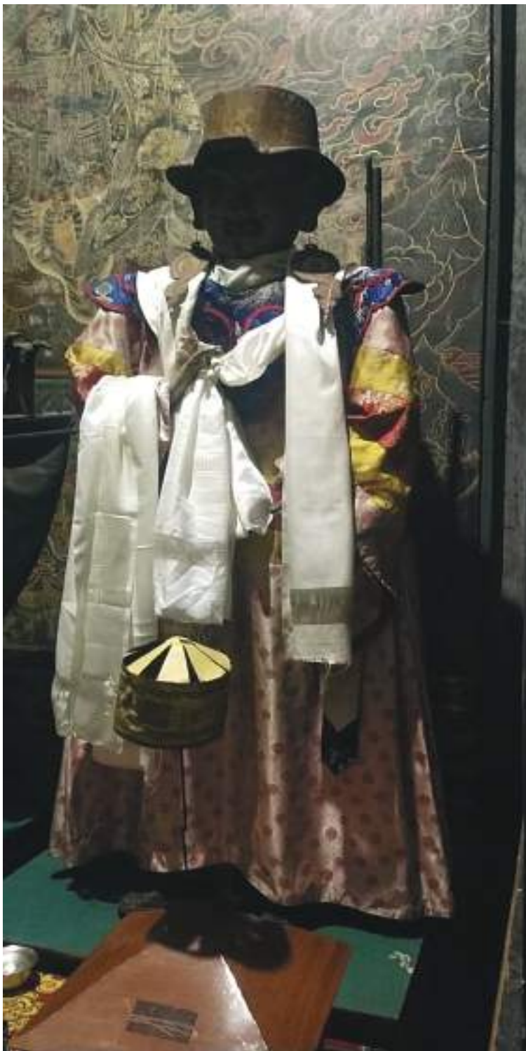
ཡོངས་ལ་དགོན་པའི་མགོན་ཁང་ནང་གི་གནས་བདག་འདོད་ཡོན་བཟང་པོའི་བཀའ་ཁྲབ།