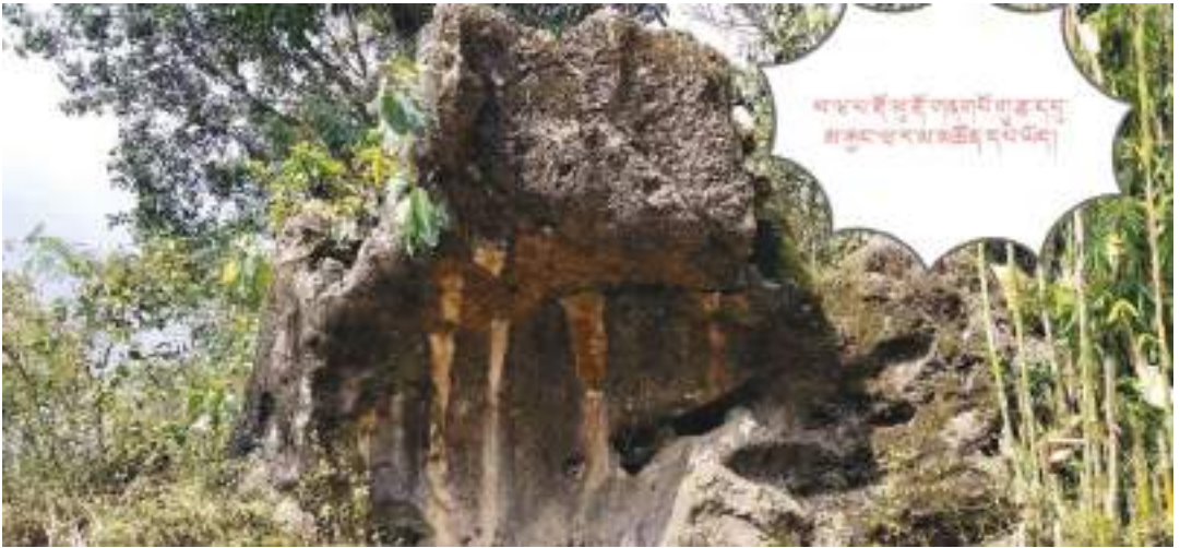
གནས་པོ་མ་ཕ་མ་ལོ་གནས་ཁང་།