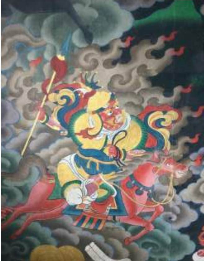
གནས་པོ་སྐྱེས་བུ་རྒྱུང་བཅན་གྱི་ལྷེབས་རིས།

གི་མདོག་ཅན་སླེ་ བཟུགས་ཏེ་ཡོད་པ་ཡིན་པས། ཡིན་རུང་ རྒྱ་རབས་ཚུ་གིས་བཤད་དོ་བཟུམ་འབད་བ་ཅིན་ ལོ་ན་ཚོད་རྒྱ་རྒྱ་སླེ་མཁུ་ཏེ་སྐྱ་དཀར་སླེ་མཇལ་ནི་ཡོད་ཟེར་བཤད་ནི་འདུག།