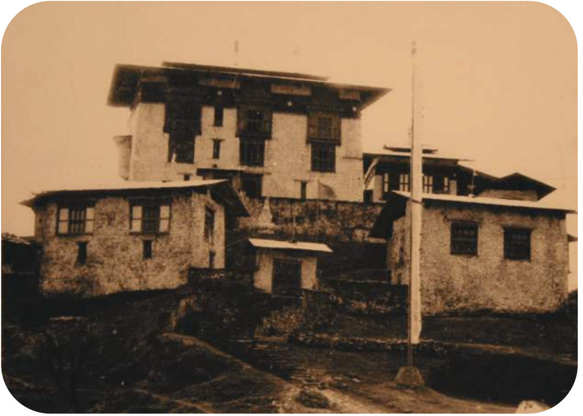
གཞུང་མ་སྒང་ཚོང་།