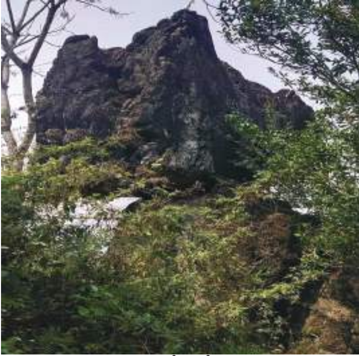
གཏེར་རྫོ་ཡིད་བཞིན་ལོར་བྲ།