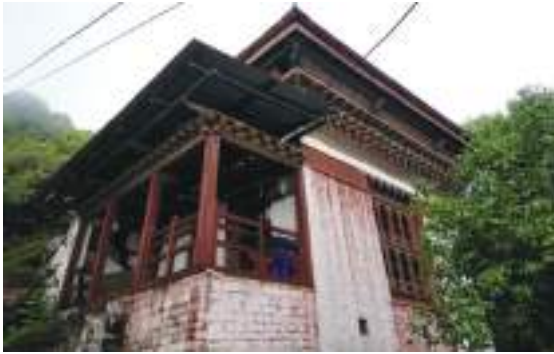
ཚེ་རིང་མའི་གནས་ལང་།

བཟང་ནང་ལུ་ སྐྱམ་བཅུན་ཚེང་མཚེད་ལཱ་འཛིན་གནས་ བྲག་ཚེན་རྗེ་ལོ་བྲང་དང་ ཚེ་རིང་མཚེད་ལཱ་འཛིན་སྐུ་ལང་ བཞུགས་ཏེ་འདུག།