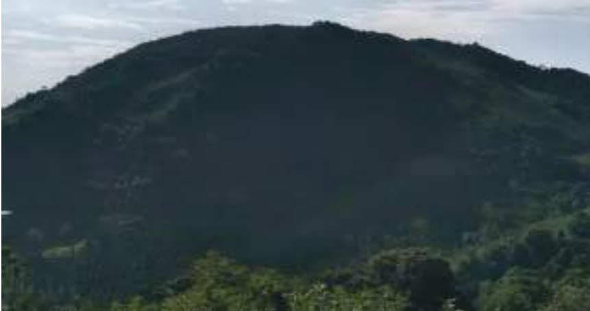
གནས་པོ་ཉི་མ་དོ་རྩེ་གི་གནས་ལང་།

གཡུས་སྤོ་འདི་ནང་ཡོད་པའི་ གནས་བདག་ཉི་མ་དོ་རྩེ་གི་གནས་ལང་ནང་ འགྲོ་བྱི་དོན་ལས་ དུས་ལུ་རྒྱར་ མ་༣༠ དེ་ཅིག་ ལམ་འགྲོལ་ད་ལྟོ་ད་ཚུགས་པས།