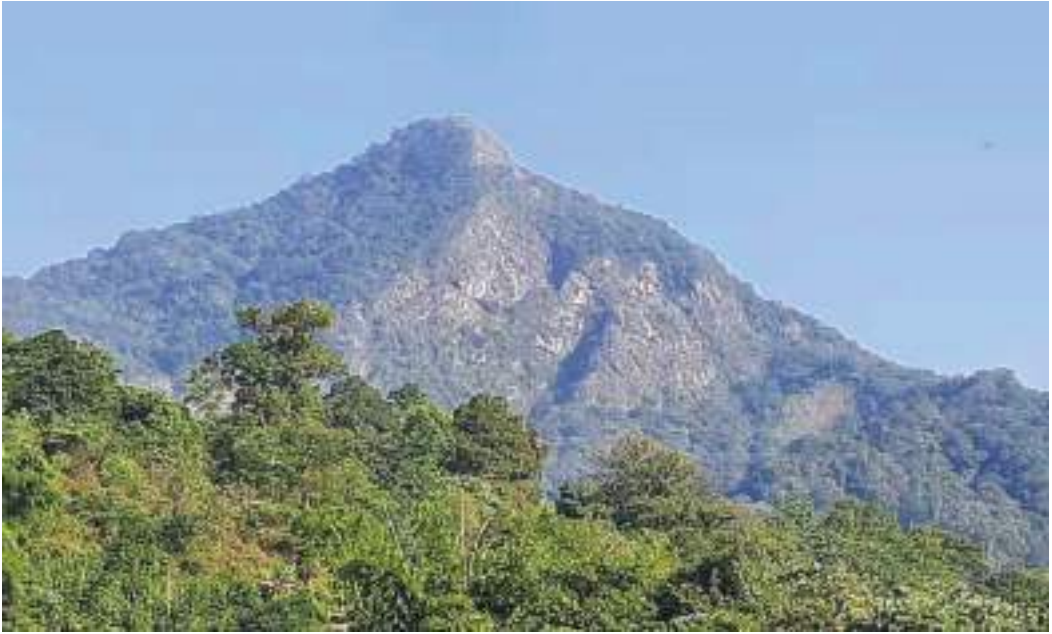
མེ་རུ་རྒྱ་ཚའི་གནས་ཁང་།

ཚོས་འཁོར་གླིང་གཡུས་སྒོ་འདི་ནང་ཡོད་པའི་གང་ཀ་རྒྱ་ཚའི་གནས་ཁང་ནང་འགྱུ་ཞི་དོན་ལས་ཀྱང་ཐང་སྡེ་ འགྱུ་བའི་སྐབས་ ཏུས་ཡུན་ཚུ་ཚོད་ཉ་དེ་ཅིག་ ལམ་འགྱུམ་ད་ལྟོད་ཚུགས་པས།