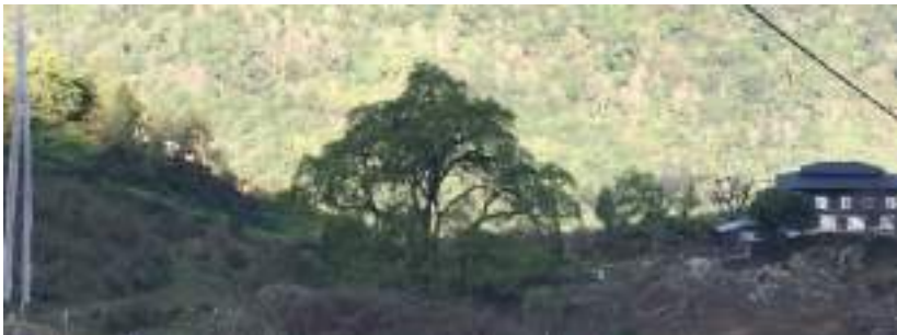
གཏེར་བདག་ཟོ་ར་ར་སྐྱེས་ཀྱི་ལྷ་ཤིང་།

གསོལ་ཁ་དཔེ་ཆ་ནང་ལས་རྩྭ་ཉི་མ་བྱང་ཤར་མཚམས་ཤེད་ན། །ཕོ་བྱང་མེ་མཚོ་འབར་བ་ནས། །འབྲུག་མཚོ་ འཁོལ་མ་སྐྱུ་རུ་རུ། །མེ་ལྷགས་འཚུབ་མ་ལུ་རུ་རུ། །ཟེར་གསལ་བ་ལྷར་འཛམ་གླིང་ །ཉི་མ་བྱང་ཤར་གྱི་མཚམས་ ལུ་ །ཕོ་བྱང་ཆེན་པོ་ །མེ་མཚོ་འབར་བའི་དབུས་སུ་བཞུགས་ཏེ་ཡོད་པ་ཡིན་པས། །འོ་མ་གླིང་གཡུས་སྐོ་འདི་ནང་ ཡོད་པའི་ །ཟོ་ར་ར་སྐྱེས་ཀྱི་ །བྲ་མཚོ་དང་ །ལྷ་ཤིང་འདི་གཡུས་ཀྱི་སྐྱུག་ལུ་མཇལ་ནི་འདུག། །ཡིན་རུང་ །བྲ་མཚོ་ འདི་སྐྱམ་འགྲོ་སྤེ་ས་ཁོངས་མཇལ་ཚུགས་པས། །གཡུས་སྐོ་འདི་ནང་ལས་རྒྱང་སྤོང་སྤེ་དུས་ལུ་ལྷན་སྐར་མ་ ༣༠ །དེ་ ཅིག་འགྲོ་བའི་སྐྱབས་ །གཡུས་ཚན་འདི་གི་ལྷག་ལུ་ཡོད་པའི་ །ཟོ་ར་ར་སྐྱེས་ཀྱི་གནས་ཁང་ །ས་གནས་ཏིང་ དཀར་བྲག་ལུ་སྤོང་ཚུགས་པས།