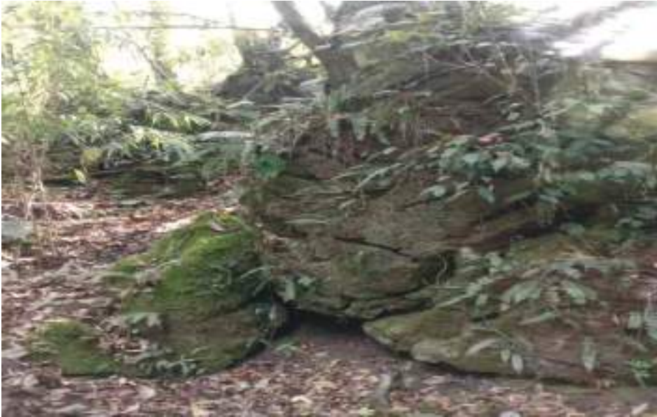
གསོལ་ཁ་དཔེ་ཆ་ནང་དུ།

བཙན་ནི་མི་དམར་རྟ་རུ་དམར། སྐྱེས་བུ་བྲག་བཙན་དམར་པོ་བཞུགས། སྐྱུ་མདོག་དམར་པོ་མདངས་དང་ལྡན། །ཞལ་གཅིག་ཕྱག་གཉིས་མཛེས་པ་ལ། སྐྱུ་ལ་བསྐྱེད་འབྲེལ་དམར་པོ་གསོལ། དབྱུ་ལ་ཟངས་ཚོག་དམར་པོ་ གསོལ། ཕྱག་གཡས་ཟངས་ཀྱི་མདུང་དམར་པོ། །འབྲེལ་དམར་པོ་དེ་བཙན་བཏགས། ཕྱག་གཡོན་བསེ་ཡི་ མདའ་གཞུ་བསྐྱེས། ། ཞེས་པ་ལྟར་ བཙན་སྐྱེས་བུ་བྲག་བཙན་ནི་ སྐྱུ་མདོག་དམར་པོ་མདངས་དང་ལྡན་ པ་ ཚིབས་རྟ་དམར་པོ་ལྟེང་དུ་བཞོན་པ་ ཞལ་གཅིག་ཕྱག་གཉིས་སྐྱུ་ལ་ན་བཟའ་བསེ་འབྲེལ་དམར་པོ་བཞེས་ཏེ་ དབྱུ་ལ་ཟངས་ཚོག་དམར་པོ་གསོལ་བ་ཕྱག་གཡས་པ་ལུ་ ཟངས་ཀྱི་མདུང་དམར་དང་ སྐྱུ་ལ་གོ་འབྲེལ་དམར་ པོ་དེ་བཙན་བཏགས་པ་ ཕྱག་གཡོན་པ་ལུ་བསེ་ཡི་མདའ་གཞུ་བསྐྱེས་པ། སྐྱུ་ལ་པ་མི་དམར་ལྟེང་དུ་རྒྱུག་པ་ ལྟེང་ནས་བྲུ་དམར་ལྟེང་བ་ རྒྱབ་ནས་ཀྱི་དམར་བྲངས་བ་ འོད་དམར་འཕྲུབ་པ་བཙན་ཞག་དམར་པོ་འཕྲུག་པ་ བཙན་གྱི་དམག་དབྱུང་ཚོགས་པའི་དབྱུས་སུ་བཞུགས་འདི་ཡོད་པ་ཡིན་པས།