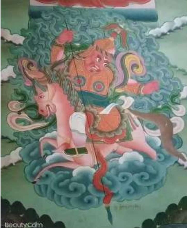
མཁའ་ལྷ་ཁང་ནང་ལུ་བཞུགས་ཡོད་པའི་ སྐྱེས་བུ་བྲག་བཙན་གྱི་ལྷེབས་རིས།