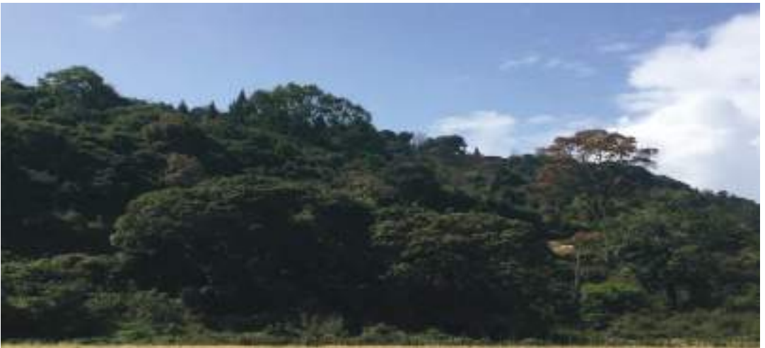
གནས་ཁང་།

གིང་རིགས་སྣ་ཚོགས་དང་ ཅི་བཟང་པོའི་མེ་ཉོག་སྣ་ཚོགས་ཤར་ཉེ་ གཡུས་གཡོན་ལས་ཚུ་བླན་ཆེ་རྒྱུང་བབས་ཉེ་ སྲོ་ལྷང་ལྷན་པའི་ ས་གནས་ཉམས་དགའ་ཉོག་ཉོ་སྤོ་ མདངས་ཁར་གཡུས་ཀྱི་སྐྱུག་ལུ་མཇལ་ནི་འདུག།