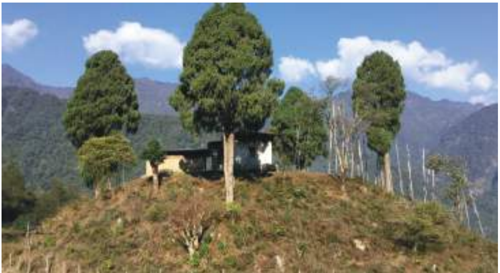
གནས་པོ་དཔལ་བཟང་དོ་ཇེ་གི་གནས་ཁང་།