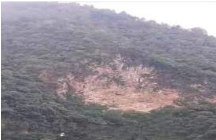
བྲག་དམར་ཅེན་ཇ་རྒྱ་ཇ་པོ་བྲང་བྲག་དམར།

གནས་ཁང་ཡང་ ཤིང་སྐྱ་འཛོམས་པའི་སྐྱུག་ལུ་ བྲག་ཆེན་གཅིག་མཇལ་ནི་འདུག། བྲག་གི་མཚན་ཡང་བྲག་ དམར་ཟེར་ལུ་ནི་འདུག།