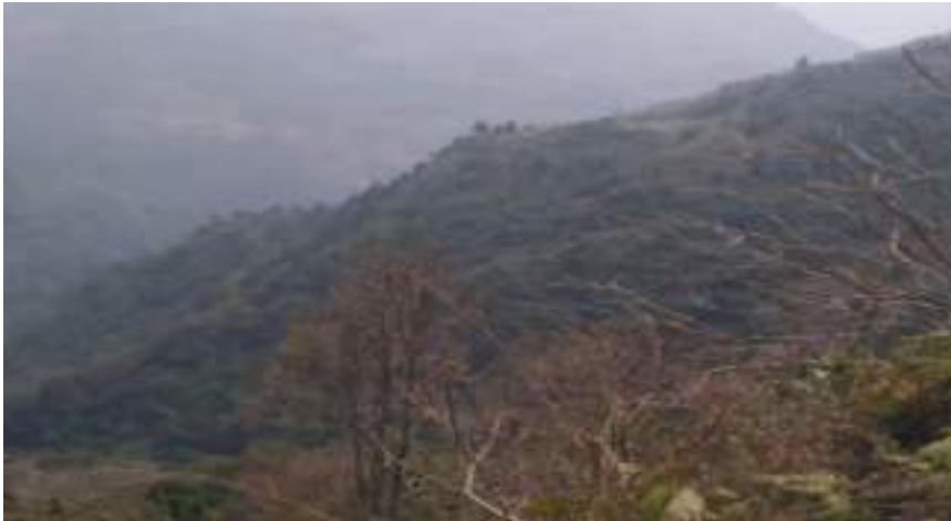
མ་ཐར་མི་གནས་པོའི་ཕོ་བྲང་།

དང་ཤིང་རིགས་སྣ་ཚོགས་ཀྱི་དངོས་གྲུབ་ཁང་གཅིག་ཨོན་ཏེ་པས།