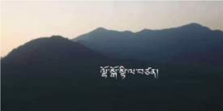
སྡོ་སློ་ཉི་ལ་བཙན་གྱི་གནས་ཁང་།

གཡུས་སློ་འདི་ནང་ལས་ ཀང་ཐང་སྡེ་ དུལ་ཡུན་སྐར་མ་༤༠་དེ་ཅིག་འགྲོ་བའི་སྐབས་ རི་རྒྱལ་ལྟར་མཐོ་བ་སྡེ་ ཤིང་དང་ནགས་ཀྱིས་བསྐོར་བའི་ དྲི་བཟང་མེ་ཏྲོག་ཚོགས་ཤར་ཏེ་ སྡོ་ལྗང་ལྟར་སྡེ་ གཡུས་སློ་འདི་ནང་ལས་ སྡོ་ཁ་ཐུག་ལུ་མཇལ་ནི་འདུག།