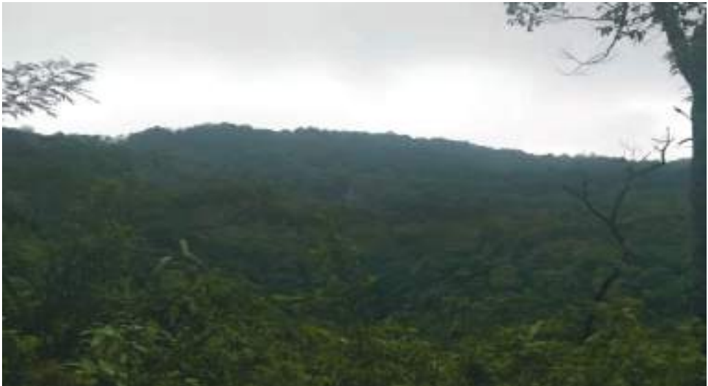
གང་ཀ་རྒྱ་ཚའི་གནས་ཁང་།

ཚོས་འཁོར་གླིང་གཡུས་སྒོ་འདི་ནང་ཡོད་པའི་གང་ཀ་རྒྱ་ཚའི་གནས་ཁང་ནང་འགྱུ་ཞི་དོན་ལས་ཀྱང་ཐང་སྡེ་ འགྱུ་བའི་སྐབས་ ཏུས་ཡུན་ཚུ་ཚོད་ཉ་དེ་ཅིག་ ལམ་འགྱུམ་ད་ལྟོད་ཚུགས་པས།