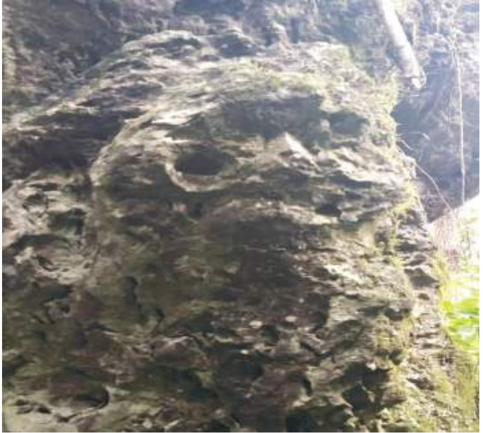
ཡབ་དོང་དོང་སྐྱ་རིའི་གནས་ཁང་།