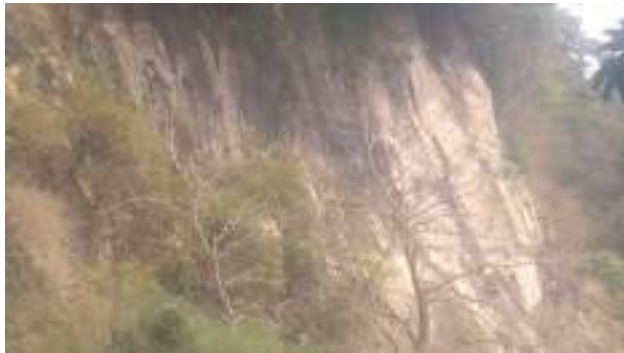
སྟག་ལྷ་བཙན་གྱི་གནས་ཁང་།

འདི་བཟུམ་སྟེ་ གཡུས་སློའདི་ནང་ཡོད་པའི་ བཙན་ཚོད་སྟག་ལྷའི་ཕོ་བྲང་ཡང་ རི་རྒྱལ་ལྷར་མཐོ་བའི་ ཤིང་ དང་ནགས་ཀྱི་བརྒྱན་ཏེ་རི་དྲགས་སེམས་ཅན་ སྤྲོའོགས་འབྲུམ་སའི་གནས་བཟང་ ཅི་ཞེས་མེ་ཏོག་སྤྲོ་ཚོགས་ ཤར་ཏེ་ཡོད་པའི་ གནས་ཁང་འདི་གཡུས་སློའདི་ནང་ལས་མཇལ་ཚུགས་པས།