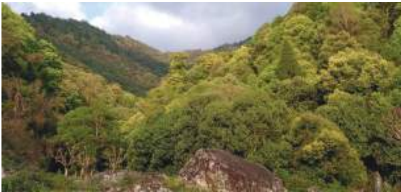
སྐང་དར་ཡུང་མའི་གནས་ཁང་།

རྒྱ་ཐང་སྟེ་འགྲོ་བ་ཅིན་ དུས་ལུན་སྐར་མ་ ༢༠ དེ་ཅིག་ལུ་ས་གནས་སྐང་དར་ཡུང་ལྟོད་ཚུགས་པས།