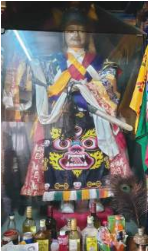
གནས་པོ་རྗེ་རབ་བརྟན།

རུང་པའི་དགའ་བོའི་རྣམས་སློག་ཅུ་གཙོད་ནས་ ལྷགས་པ་སྐྱ་ གཡོག་པའི་གུར་བཞོན་ཏེ་ཞབས་གཉིས་ལུ་ སག་ ལྷམ་བཞེས་ཏེ་ གསང་བའི་ཡུམ་སྐྱབ་བཙུན་པ་སྐྱ་ལྷམ་ཏེ་ཡེ་ལའོར་དང་བཅས་ཏེ་བཞུགས་ཡོད་པ་ཡིན་པས། ཡུམ་སྐྱབ་བཙུན་པ་སྐྱ་ལྷམ་ཏེ་ཡེ་ལའོར་ ཞལ་མཛེས་ཤིང་ཡིད་དུ་འོང་བའི་ཁར་ ཕྱག་གཡམས་པ་ལུ་ མདའ་དར་སྐྱ་ ལྷ་བསྐྱམས་ཏེ་སྐྱེ་འགོ་ཀུན་གྱི་ ཚེ་དང་བསོད་ནམས་ལྷག་པའི་ཕྱིར་དུ་ ཕྱག་གཡོན་པ་ལུ་ གཏེར་གྱི་བུམ་བཟང་ འོར་བུའི་ལ་རྒྱན་གྱི་འགོ་བ་ཀུན་ལུ་ གང་འདོད་གྱི་དངོས་གྲུབ་སྐྱོལ་བར་མཛད་དེ་ འཁོར་དུ་སྐྱུ་བདུད་བཙུན་ དང་བཅས་ཏེ་བཞུགས་ཡོད་པ་ཡིན་པས།