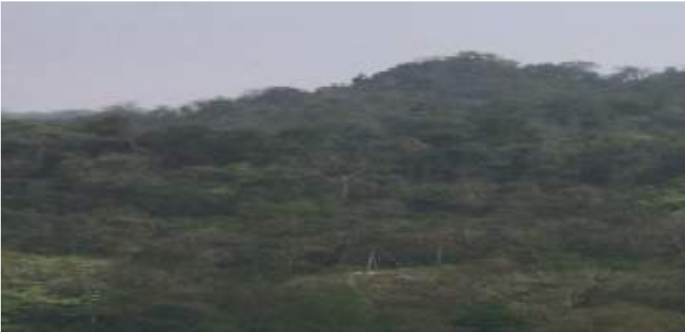
ལྷ་ལྷོ་ མཁའ་འགོ་རྒྱ་ཇ་ཇི་ལོ་བྱང་གནས་ཁང་།

བསོད་ནམས་བང་སྤྱི་འོག་ལས་ ལྷོ་མཁའ་འགོ་བའི་རྒྱབས་ ཏུས་ལུན་ རྒྱ་ཇོ་དང་སྐར་མ་༣༠་དེ་ ཅིག་ལུ་ ལྷ་ལྷོ་གི་ཁོང་གི་ལོ་རྒྱུས་པས། ལྷ་ལྷོ་གི་ཁོང་གི་གདོང་ལྷོགས་ལུ་ མཁའ་འགོ་རྒྱ་ཇ་ཇི་ལོ་བྱང་ སྤྱི་འོག་དང་ལྷོ་སྤོ་ལོ་ལོ་ལོ་དོན་ལུ་ལོ་རྒྱུས་པས།