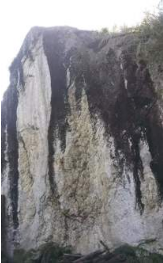
བྲག་ལ་མཁར་མོ་ལུ་ཡོད་པའི་ཨ་པ་བཙན་གྱི་གནས་ཁང་།

ར་དི་གཡུས་ཀྱི་ལྷག་ལུ་ཡོད་པའི་ས་གནས་བྲག་ལ་མཁར་མོ་བཙན་གྱི་གནས་ཁང་ནང་འགྲོ་ཞིའི་དོན་ལས་རྒྱ་ བང་སླེ་འགྲོ་བའི་སྐབས་ ཏུས་ཡུན་སྐར་མ་ ༣༠ དེ་ཅིག་ལུ་ རྫོང་རིང་དཀར་པོ་སླེ་ཡོད་པའི་ས་གནས་མཁར་ཚང་ སུ་ལུ་སྟོད་ཚུགས་པས།