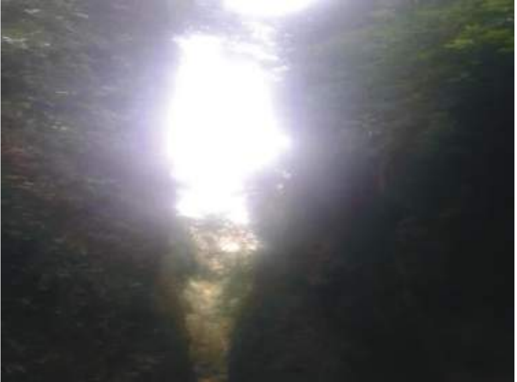
ཨ་ཕང་བདུད་པོ་གནས་ཁང་།