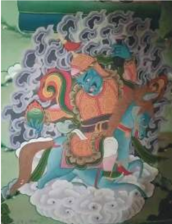
གནས་པོ་ནི་ལེ་ཐོད་དཀར་གྱི་ལྷེབས་རིས།

གསོལ་ཁ་དཔེ་ཆ་ནང་ལུ་ ཞལ་གཅིག་ཕྱག་གཉིས་སྐྱེ་མདོག་སྟོ། ཆིབས་སུ་སྐྱེ་ཉ་སྟོན་པོ་ཆིབས། ཕྱག་གཡས་ མོར་བུ་འབར་བ་བསྐྱམས། གཡོན་པ་མོར་བུའི་རྒྱལ་པ་ཐོགས། སྐྱེ་ལ་གཡུ་ཁབ་སྟོན་པོ་གསོལ། དབུ་ལ་ དབུ་མོག་སྟོན་པོ་གསོལ། གོང་མེད་སྟོན་པོ་རླུང་ལྟར་འཚུབ། འཁོར་དུ་སྐྱེ་སྐྱེ་ཉ་འབུམ་གྱིས་བསྐྱོར། ཞེས་ གསལ་བ་ལྟར་གནས་བདག་འདི་ཉིད་ ཞལ་གཅིག་ཕྱག་གཉིས་ སྐྱེ་མདོག་སྟོན་པོ་ ཆིབས་ནི་སྐྱེ་ཉ་སྟོན་པོ་གུར་ ཆིབས་ནས་ ཕྱག་གཡས་པ་ལུ་མོར་བུ་འབར་བ་བསྐྱམས་པ་ ཕྱག་གཡོན་པ་མོར་བུའི་རྒྱལ་པ་ཐོགས་པ་ སྐྱེ་ གཟུགས་ལུ་གཡུ་ཁབ་སྟོན་པོ་གསོལ་བ་ དབུ་ལ་མོག་སྟོན་པོ་གསོལ་བ་གོང་མེད་དར་སྟོན་པོ་རླུང་ལྟར་འཚུབ་པ་ འཁོར་དུ་སྐྱེ་སྐྱེ་ཉ་འབུམ་གྱིས་བསྐྱོར་ཉེ་བཞུགས་ཡོད་པ་ཡིན་པས།