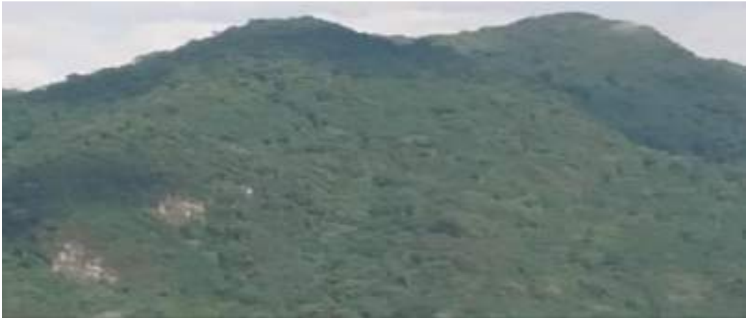
ལུབ་ཚང་མ་གླིང་བཙན་གྱི་གནས་ཁང་།

ཚང་མ་གླིང་བཙན་འདི་གཡུས་སློའདི་ནང་ ལུབ་སློའ་སྤྱང་བའི་བདག་པོ་ཡིན་པས་ གཡུས་སློའདི་ནང་ལས་ ཚང་ཕུ་ལུ་འགྲོ་ནི་དོན་ལས་ ཀང་སྟོང་སྤེ་འགྲོ་བའི་རྒྱབས་ ཏུས་ཡུན་སྐར་མ་༢༠ དེ་ཅིག་ལུ་ སྤོ་སྤྱང་དང་ལྷན་ པའི་ རི་བོ་སེང་གོ་འགྲིང་པ་དང་ འབྲ་བའི་ནང་སྟོད་ནི་འདུག།