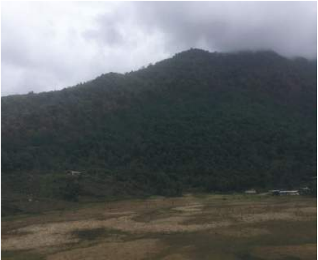
བྱ་ལི་ཅི་བྲག་བཙན་ཆེན་གྱི་གནས་ཁང་།