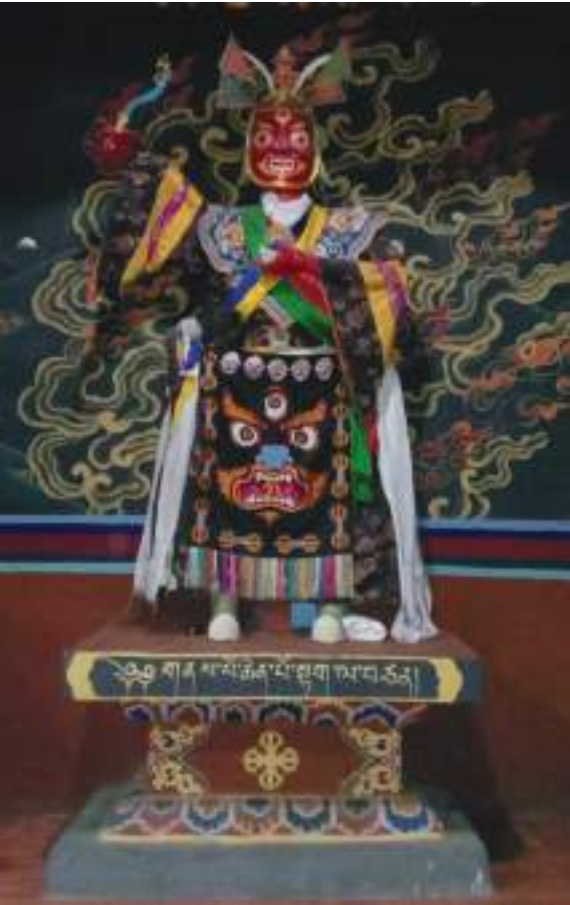
བསོད་ནམས་ཐང་མགོན་ལང་ནང་ལུ་བཞགས་ཡོད་པའི་ སྟག་ལྷ་བཙན་གྱི་ཀ་ལྷབ།

སྟག་ལྷ་བཙན་གསོལ་ལ་ལས། གྱིད་ མི་འགྱུར་བསམ་ཡས་མོ་བྲང་དུ། སློབ་དཔོན་པར་བཟོ་ཡིས། སྟུན་སྲར་ བཀུགས་ནས་དམ་ལ་བཏགས། །བཀའ་ཡི་ཚད་ལས་མ་འདའ་ཞིག། །ཅེས་པ་ལྟར་ སྟུན་སློབ་དཔོན་ཚེན་པོ་ ལྷོན་གུ་རུའི་ཞབས་ནས་ སངས་རྒྱས་བསྟན་པའི་སྟོག་ཤིང་ བསམ་ཡས་མོ་བྲང་བཞེངས་པའི་སྐབས་ལུ་སྟུན་ སྲར་བཀུག་ཏེ་ སངས་རྒྱས་ཀྱི་བསྟན་པ་ འདི་འཛིན་པའི་རྣལ་འབྱོར་པ་ཚུ་དང་ སེམས་ཅན་གུན་ལུ་སྟོང་ གོགས་མཛད་ནིའི་དོན་ལས་ བཀའ་དང་དམ་ལུ་བཞག་གནང་ཅུག།