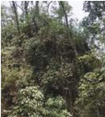
ཕུ་ལ་སྣེས་ས་གནས་བར་བི་ལུ་ལོད་པའི་ ཕོ་ལྷ་སྣང་གི་བདུད་པོའི་གནས་ཁང་།

གསོལ་ཁ་དཔེ་ཆ་ནང་ལས་ ཕོ་བྱང་རི་མོ་བར་སྤྱི་སི་ཚེན་རིང་། །སྣང་གི་བདུད་པོ་ཕོ་ལྷ་འཁོར་དང་བཅས། །ཕོ་བྱང་ཡུལ་མོ་ཕྱོགས་འདྲིར་གནས་མཚོག་བཞུགས། །ལྷ་སྣེན་སྟེ་བརྒྱན་འཁོར་དང་བཅས་པ་ཡི། །ཞེས་པ་ལྟར་གཞི་བདག་སྣང་གི་བདུད་པོའི་ཕོ་བྱང་འདི་ །ཤིང་རིགས་སྤྱོད་ཚོགས་ །འཛོམས་པའི་སྐྱབས་ལུ་ །ག་ནི་བ་ཉམས་དགའ་བའི་ །གནས་བཟང་མཇལ་ནི་གི་དོན་ལས་ཕུ་ལ་སྣེས་སྤྱི་འོག་ལས་རྒྱང་ཐང་སྟེ་འགྲོ་བ་ཅིན་ །དུས་ལུན་རྒྱར་མ་ 30 །དེ་ཅིག་ལུ་གནས་པའི་ཕོ་བྱང་ །ས་གནས་བར་བི་ལུ་ལྟོད་ཚུགས་པས།