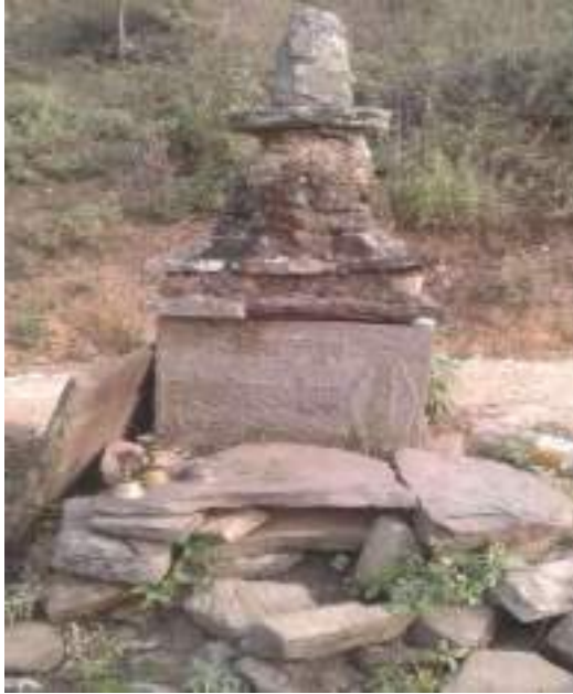
དལ་ལྷོ་བསྟན་པ་བཟང་པོའི་གནས་ཁང་།