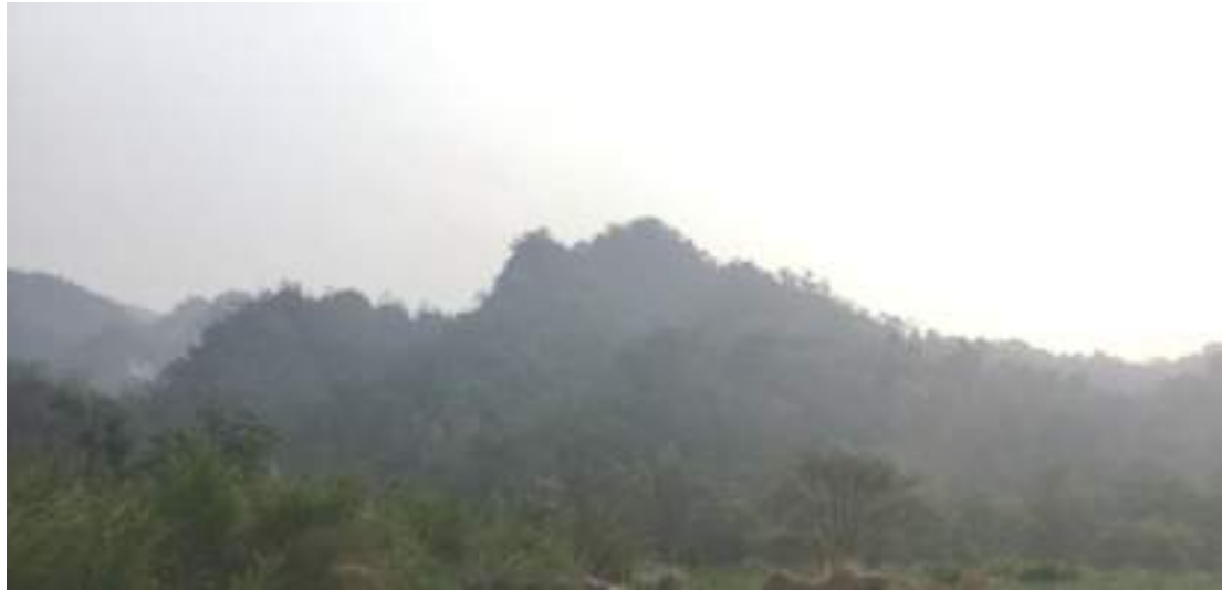
ཉིང་མོ་རྒྱ་ཇའི་གནས་ཁང་།

སྡོ་ལྗང་ཤིང་ནགས་དང་ མེ་ཉོག་སྤྲོ་ཚོགས་ཤར་ཉེ་ རི་དྲུགས་སེམས་ཅན་སྤྲོ་ཚོགས་འབྲམས་ཉེ་ཡོད་པའི་ཉིང་ མོ་ར་ཇའི་གནས་ཁང་མ་རྒྱུ་རྒྱུ་པའི་ཕོ་བྲང་གི་གདོང་རྩོགས་ལུ་ཉིང་མོ་ར་ཇའི་ཕོ་བྲང་མཐོང་ཚུགས་པས།