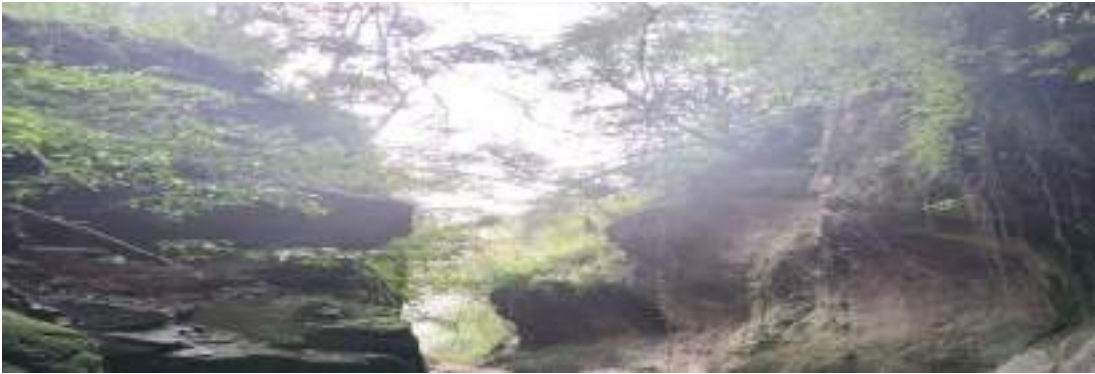
མོང་པ་ལས་གནས་པའི་ཐོ་བྲང་།

གཞི་བདག་སྤྱི་འགྲོའི་གསོལ་ཁ་ནང་ལུ། རྩོད་ གཙུག་ལག་ཁང་དང་དགོན་གནས་ཡུལ་འཁོར་དང་། །ས་དང་རི་ བོ་ཀུན་ལ་གནས་པའི་ཡི། །ཞེས་གསལ་བ་ལྟར་ རི་བྲག་གསེར་གྱི་བ་གམ་ཅན་གྱི་བསྐྱོར་བ་གཡུ་མཚོ་སྟོན་པའི་ འཁྲིལ་བ་ རིན་ཆེན་རྣམ་པ་ལྷ་གིས་བརྟེན་པའི་ ཐོ་བྲང་མཛེས་པའི་གནས་མཚོག་ལུ་བཞུགས་ཏེ་ཡོད་པ་ཡིན་ པས།