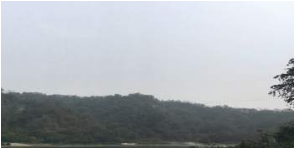
དེམོ་རྩ་ཇའི་གནས་ཁང་།

བསོད་ནམས་ཐང་སྤྱི་འོག་ལས་ ལྷུ་མ་འཁོར་ནང་འགྲོ་བའི་སྐབས་ དུས་ལུན་ ཚུ་ཚོད་༡ དང་སྐར་མ་༣༠ དེ་ ཅིག་ལུ་ ལྷ་ནམི་གླིང་ཀ་ནང་སྟོན་ཚུགས་པས་ ལྷ་ནམི་གླིང་ཀའི་གདོང་ཕྱོགས་ལུ་ སྤོ་ལྷང་དང་ལྷན་པའི་དེམོ་ རྩ་ཇའི་ཕོ་བྱང་མཐོང་ཚུགས་པས། གནས་པོ་ས་ཁོངས་ནང་ རྟོག་མ་ཤིང་ཡོད་པའི་ལོ་རྒྱུས་བཤད་ནི་འདུག་ ས་ གོ་འདི་ནང་འགྲོ་བའི་སྐབས་ རྟོག་མ་བཏོག་ཟ་བ་ཅིན་མི་ལུ་རྒྱུན་པར་འབྱུང་ནི་ཡོད་ཟེར་བཤད་ནི་འདུག།