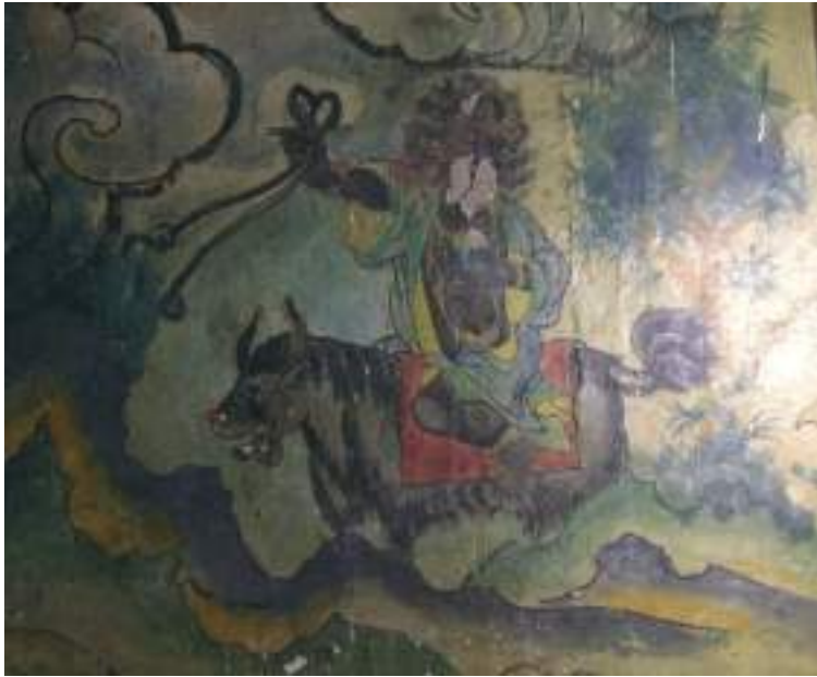
གནས་པོ་དཔལ་བཟང་དོ་རྗེ་གི་ལྷེབས་རིས།