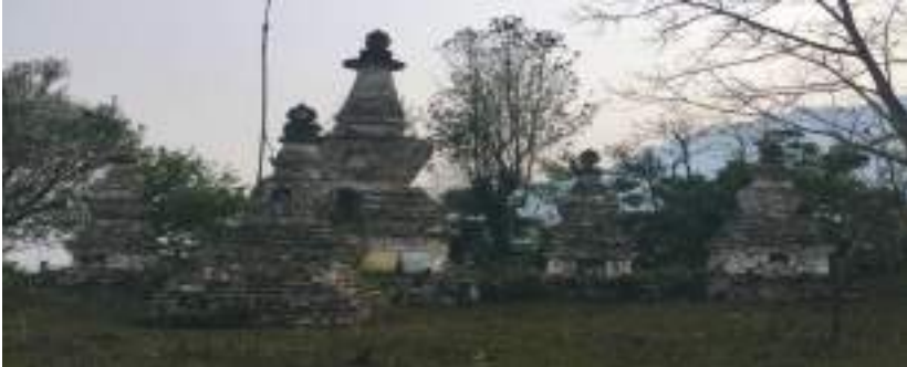
གསོལ་མཚོད་ཕུལ་སའི་ས་གནས།

གསོལ་ཁ་ནང་ལུ་ གཤེགས་ནི་གངས་རི་ལོགས་ལས་གཤེགས། །མཚོད་ནི་རིན་ཆེན་དངུལ་གྱིས་མཚོད། །ཡང་ ན་ངར་སྐྱུད་འདི་ཡིས་མཚོད། །ཡང་ན་སྙན་པའི་ཚིག་གིས་མཚོད། །ཟེར་གསལ་དོ་བཟུམ་ སྲིང་བཞི་བཙན་ལུ་ གསོལ་མཚོད་ཡང་ ལོ་ལྟར་རང་ལྷན་པའི་ཚེས་༡༥ལུ་ གཡུས་སློའདི་ནང་གི་མི་སེར་ག་ར་ ས་གནས་སྟོ་ཏོག་ མཚོད་ཏེན་ལུ་ འཛོམས་ཐོག་ལས་ གནས་པའི་གསོལ་མཚོད་བརྒྱ་ཚར་སྟེ་འཕུལ་སོལ་འདུག་ ཡོངས་གྲགས་ ལུ་ གནས་པོ་བརྒྱ་ཚར་ཟེར་སྐབ་ནི་འདུག་དེ་སྟེ་གསོལ་མཚོད་ཕུལ་དགོ་པའི་རྒྱ་མཚན་ཡང་ གནས་བདག་ལུ་