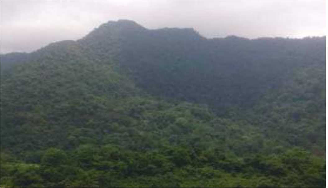
རྫོང་ལ་བཅོན་གྱི་གནས་ཁང་།